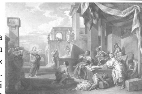
Giovanni Paolo PANINI, Zov svetog Mateja , 1752. g. muzej Milan

U ono vrijeme: Isus, prolazeći, ugleda čovjeka zvanog Matej gdje sjedi u carinarnici. I kaže mu: »Pođi za mnom!« On usta i pode za njim. Dok je Isus bio u kući za stolom, gle, mnogi carinici i grešnici dođoše za stol s njime i njegovim učenicima. Vidjevši to, farizeji stanu govoriti: »Zašto vaš učitelj jede s carinicima i grešnicima?« A on, čuvši to, reče: »Ne treba zdravima liječnika, nego bolesnima. Hajdete i proučite što znači: Milosrđe mi je milo, a ne žrtva. Ta ne dođoh zvati pravednike, nego grešnike.«